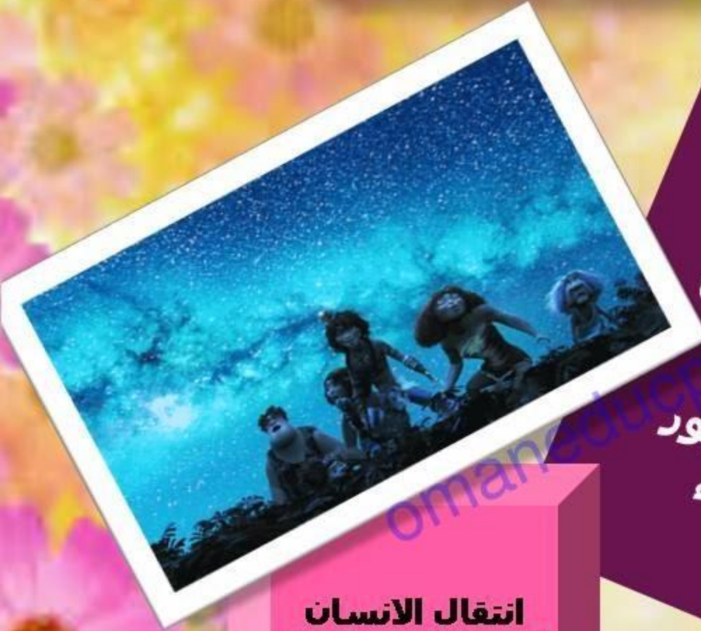
انتقال الانسان القديم (السياحة)